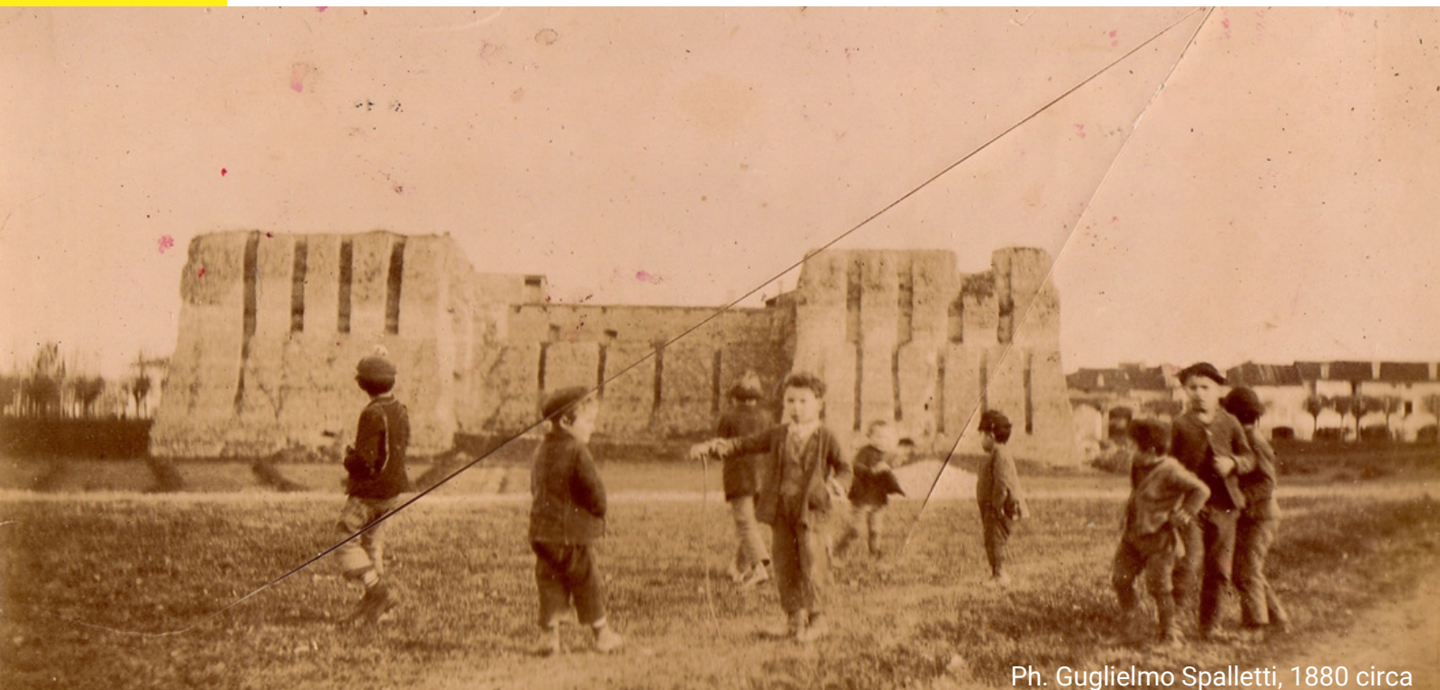
1880 circa